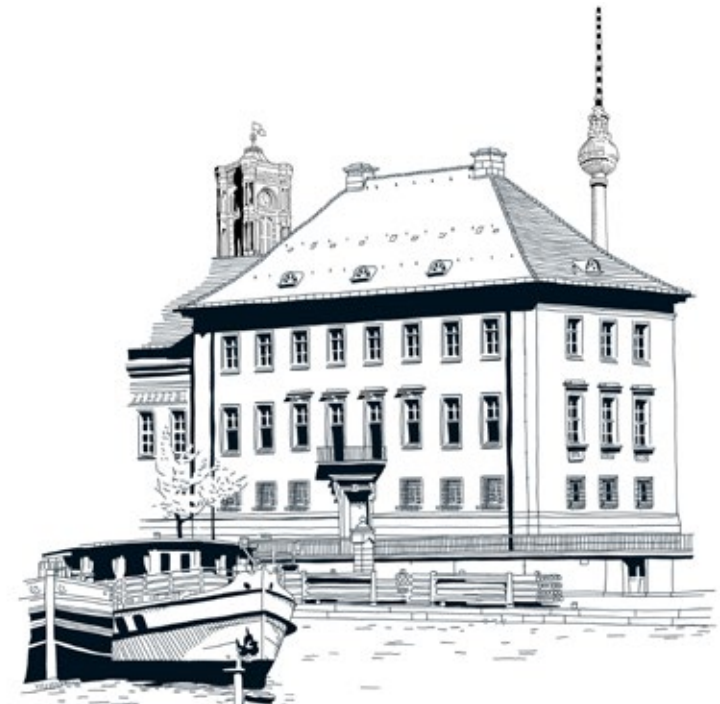
Direktorenhaus - Zentrum für aktuelles Design und angewandte Künste